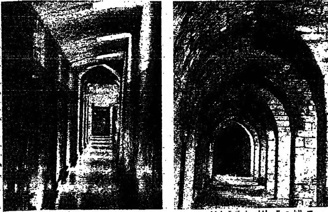
الطريق الى المطعم في قلعة طرابلس